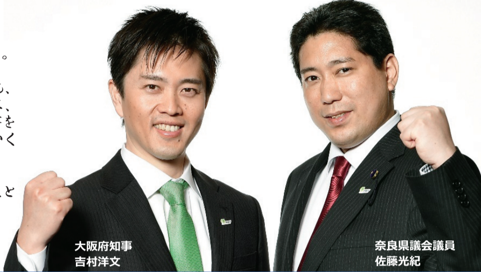
大阪府知事 吉村洋文